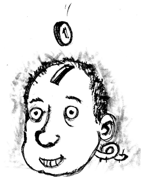
nieuwe minister financiën. (artists impression)

Mark, Wilders heet Geert. Maar de Jagers? Is het nu Jan Kees of Kees Jan? Navraag op het centraal station in Leiden helderde het mysterie niet op. Een derde van de ondervraagden zegt het niet te weten, een derde zegt dat hij Jan Kees heet. En u vermoedt het al, een derde noemt hem Kees Jan. Wat Jan Kees, Kees Jan of ik weet het niet nu voor de kost doet? Een jonge dame weet te melden dat Jan Kees, Kees Jan, weet ik niet, een gezellig klein dikkertje is met een vrolijke lach. Haar vriendin vult deze informatie aan. Met stellige zekerheid probeert zij de verslaggever te overtuigen dat Jan Kees, Kees Jan, weet ik niet, schrijver is. Hij schrijft stukjes en kinderboeken. Een oudere dame daarentegen weet te melden dat Jan Kees, Kees Jan, weet ik niet, minister is, minister van financiën. En dat is maar goed ook, want mannen kunnen beter met geld omgaan dan vrouwen. Stuur een vrouw met een volle portemonnee de stad in en die is binnen het uur helemaal leeg. Zoiets zal Kees Jan, Jan Kees, weet ik niet, niet overkomen. Minister van financiën en vrijgezel: dat moet een aantrekkelijke partner zijn?! Nou nee dus, "Je moet er ook naast kunnen lopen", aldus een date-rijpe jongedame.